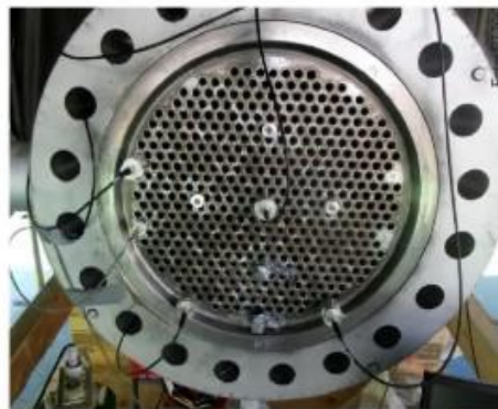
Tubvärmeväxlaren med sensorer kontakterade.

När man har den informationen kan svetsen repareras. Detta görs genom att man slipar bort svets samt lite av grundmaterialet varpå man bygger upp det borttagna materialet genom svetsning. När lagningen är klar inspekteras återigen samma område för att säkerställa att inga skador finns i det nya svetsförbandet.