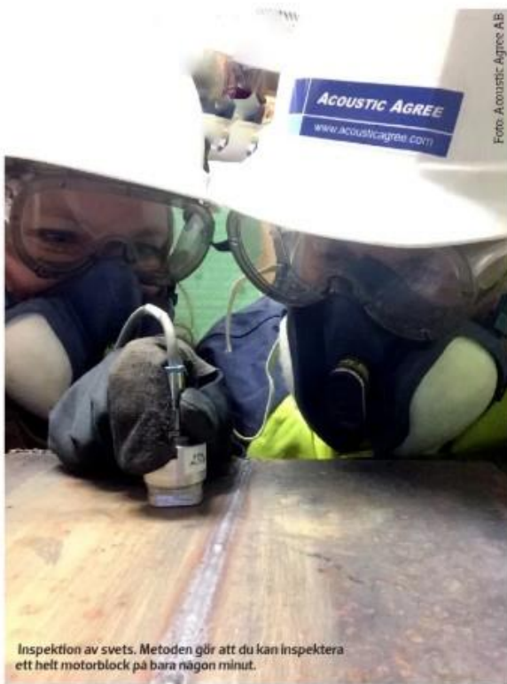
Inspektion av svets. Metoden gör att du kan inspektera ett helt motorblock på bara någon minut.

NAW är en avancerad metod för att kvalitets-säkra industrin. Det är en relativt ny inspektionsmetod som är mycket användbar genom sin mångsidighet och känslighet. Metoden kan användas för att identifiera olika typer av skador, till exempel delamineringar och porositet.