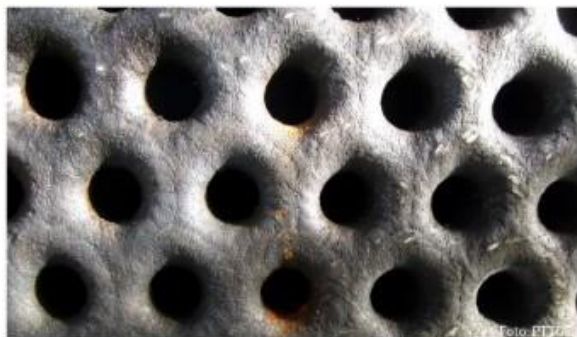
Närbild av ytan på tubvärmeväxlaren och svetsen som ska inspekteras.

Ljudvågen fortplantar sig över ett oskadat område förändras ingenting i dess karaktäristik men då vågen passerar en defekt som en spricka, påverkas ljudvågen. Den här skillnaden kan analyseras och omvandlas till ett skadevärde. Sprickor och andra defekter som porer, slagginneslutningar och bindfel kommer att påverka ljudvågen på ett ickeinjärt sätt. Ett horrat hål, en fas eller annan geometrisk avvikelser kommer inte att påverka ljudvågen eftersom dessa inte uppträder ickeinjärt. När ljudvågen samlas in i mätsystemet kommer resultatet att visas som ett värde som kallas för skadevärde.