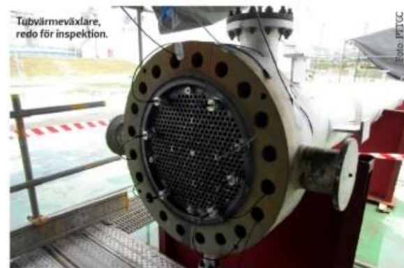
Tubvärmväxlare, redo för inspektion.

När metoden används skickas en strukturspecifik ljudvåg in i objektet via sändaren vilken fyller objektet man vill undersöka med ljudvågor. Då