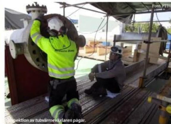
Inspektion av tubvärmväxlaren pågår.